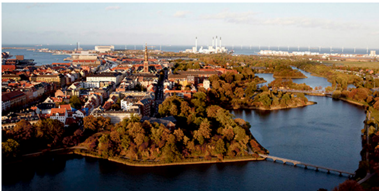
Udsigt fra Radisson Blu Scandinavia Hotel

Hotellet ligger på Islands Brygge, København, på Ny Tøjhusgrunden, lige uden for Københavns volde først på Amager. Adressen er; Amager Boulevard 70, København (tlf. +45 3396 5000). Nærmeste metrostation er Islands Brygge, der ligger ca. 5 minutters gang fra hotellet.